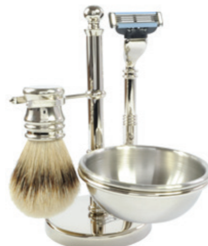
Rasiererzeug verchromt, Mach 3 shaving set, chrome, mach 3