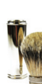
Reise Rasierpinsel, metall travel shaving brush metal