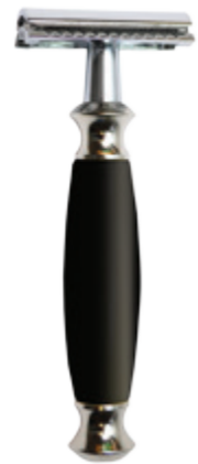
Doppelklingen-Rasierer schwarzer Griff 3 pc. safety razor black polymer handle

Choose your razor with these end numbers: 10 = Mach3 * 20 = Fusion * 30 = safety razor