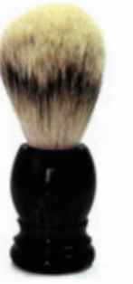
Rasierpinsel schwarzer Kunststoffgriff shaving brush black plastic handle