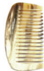
Afrokamm ca. 10,6cm* extra weite Zähne