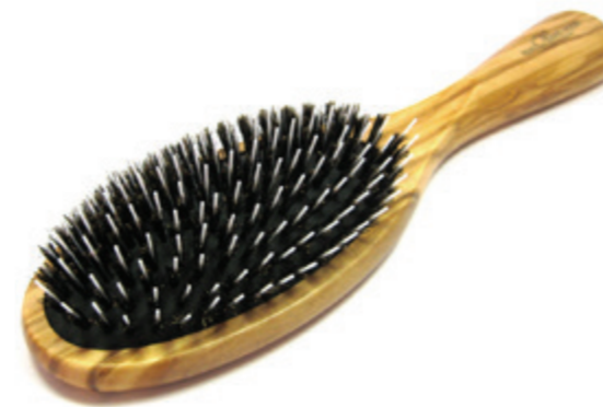
Pneumatic Bürste schwarzes Kissen | 21,5cm reine Borste | 11 Reihen Nylon