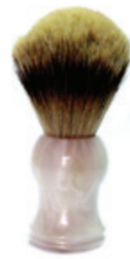
Rasierpinsel perlmutter Kunststoffgriff shaving brush m.o.p. plastic handle