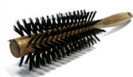
Rundbürste | 21,5cm reine Borste | 10 Reihen besonders kräftige Borste