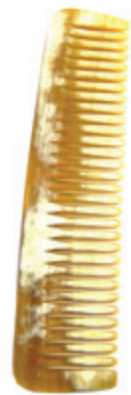
Dauerwellenkamm ca. 18cm* grob gezahnt