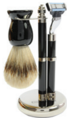
Rasierer set verchromt, Mach 3 schwarz shaving set, chrome, mach 3 black

Mach 3 | mach 3 76 4319 831_ Fusion | fusion 76 4319 832_ Doppelklinge | safety razor 76 4319 833_