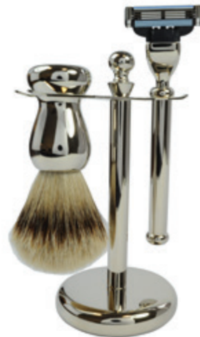
Rasiererzeug verchromt, Mach 3 shaving set chrome, mach 3