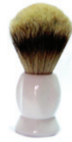
Rasierpinsel perlmutter Kunststoffgriff shaving brush m.o.p. plastic handle