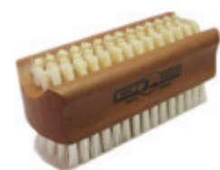
Handwaschbürste 9,5cm reine Borste 4 Reihen | 6 Reihen