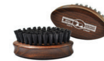
Bartbürste 6cm | reine Borste | 6 Reihen starke Borste