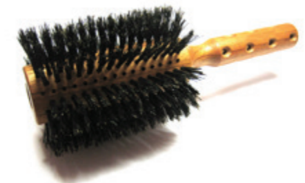
Rundbürste 22cm reine Borsten | 16 Reihen