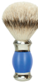
Rasierpinsel blauer Polymergriff shaving brush blue polymer handle