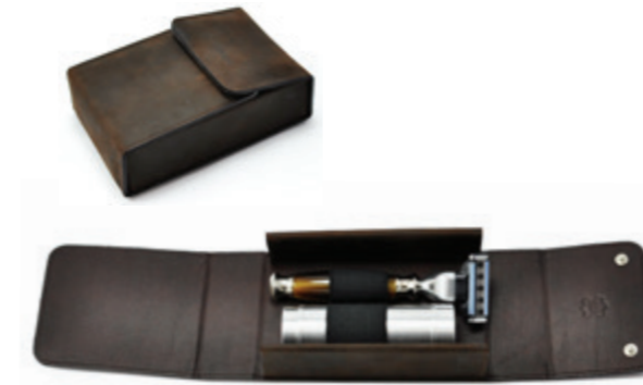
Rasier Etui feinstes Rindleder - ohne Inhalt shaving box fine cowhide - empty braun vintage | vintage brown