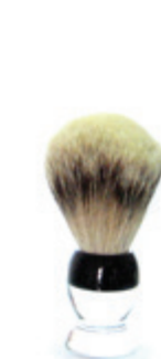
Rasierpinsel transparenter Acrylgriff shaving brush transparent acrylic handle Ø 20mm