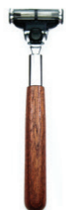
Rasierer Zedernholz-Griff razor cedar wood handle