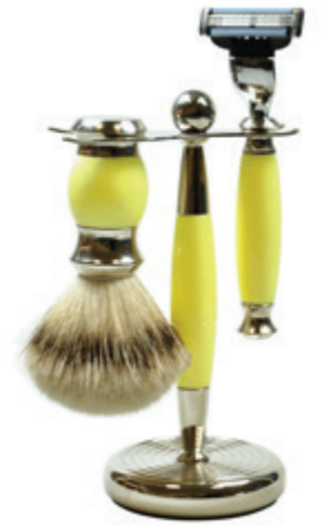
Rasierer set Polymer gelb / chrom shaving set yellow polymer / chrome

Mach 3 | mach 3 76 4319 201_ Fusion | fusion 76 4319 202_ Doppelklinge | safety razor 76 4319 203_