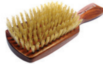
Haarbürste Clubform 18cm | reine Borste 8 Reihen | gebleicht