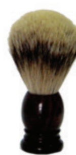
Rasierpinsel Rosenholzgriff shaving brush rose wood handle