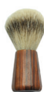
Rasierpinsel Palisander-Griff shaving brush palisander handle