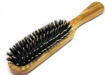
Pneumatic Bürste schwarzes Kissen | 20cm reine Borste | 6 Reihen Nylon