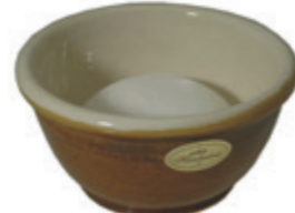
Rasierschale Keramik, braun shaving bowl ceramic, brown Ø 10,5cm