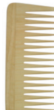
Afrokamm 13,5cm* | grob