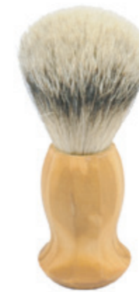
Rasierpinsel Olivenholzgriff shaving brush olive wood handle