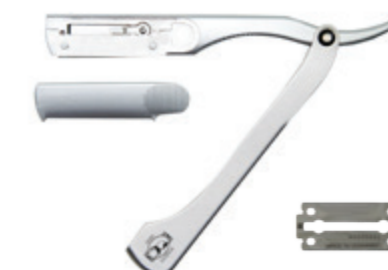
Rasierer mit Wechselklinge Aluminium, 45mm Klinge Razor with blade aluminum, 45mm blade