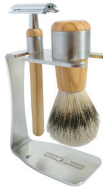
Rasieret Olivenholz shaving set olive wood