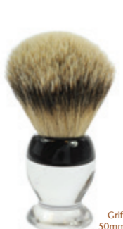
Rasierpinsel transparenter Acrylgriff shaving brush transparent acrylic handle Ø 24mm