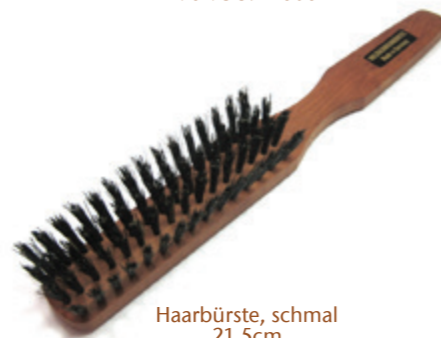
Haarbürste, schmal 21,5cm reine Borste | 4 Reihen