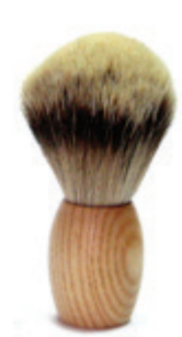
Rasierpinsel Kautschuk-Holzgriff shaving brush rubber wood handle