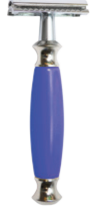
Doppelklingen-Rasierer blauer Polymergriff 3 pc. safety razor blue polymer handle