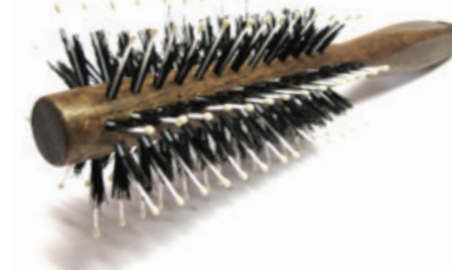
Rundbürste | 21,5cm reine Borste 8 Reihen mit Nylonstiften