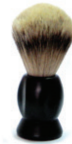
Rasierpinsel schwarzer Kunststoffgriff shaving brush black plastic handle