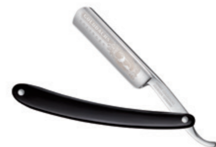
Rasiermesser Kunststoffschale, schwarz straight razor polymer handle, black