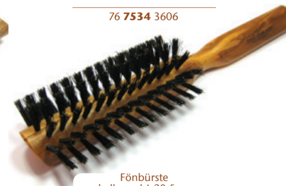
Fönbürste halbrund | 20,5cm reine Borste 180° | 7 Reihen