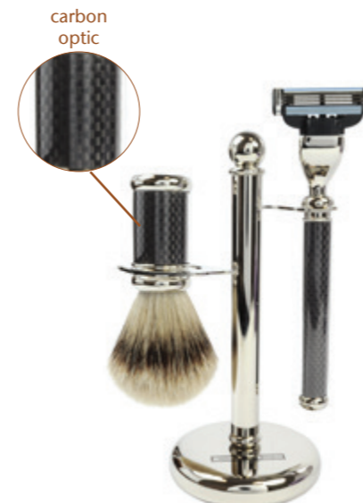
Rasiererzeug verchromt, Mach 3 shaving set, chrome, mach 3