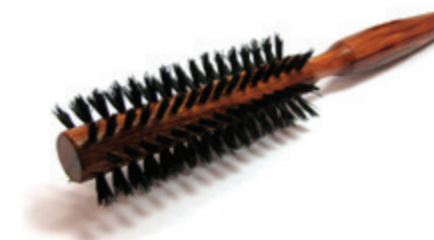
Rundbürste 21,5cm reine Borste | 8 Reihen