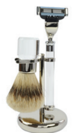
Rasiererzeug Acryl, chrom, Mach 3 shaving set acrylic, chrome, mach 3