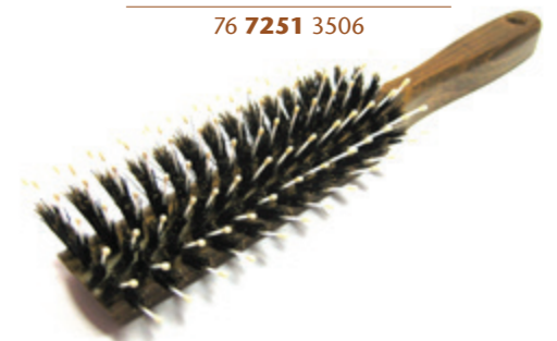
Lockenbürste | 22cm reine Borste | 8 Reihen mit Nylonstiften