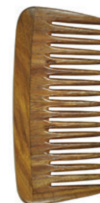
Afrokamm ca. 13,5cm* | grob