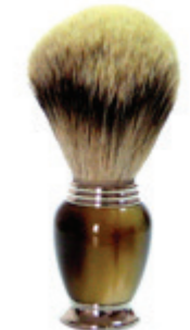
Rasierpinsel Galalith Horn-Optik shaving brush galalith horn optic handle