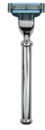
Rasierer Metallgriff razor metal handle