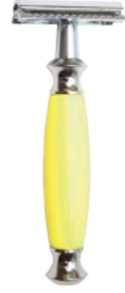
Doppelklingen-Rasierer gelber Polymergriff 3 pc. safety razor yellow polymer handle