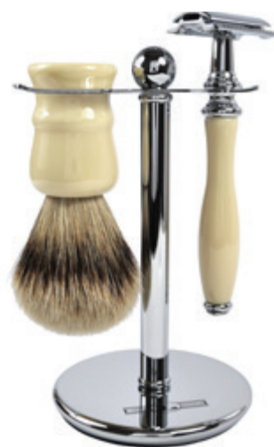
Rasiererzeug verchromt, elfenbeinfb. Kunststoff Doppelklinge | safety razor chrome, ivory polymer