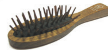
Taschenbürste | 17,8cm pneumatisch | Holzstifte | 5 Reihen | schwarzes Kissen