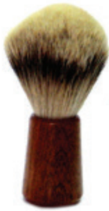
Rasierpinsel Zedernholzgriff shaving brush cedar wood handle