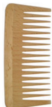
Afrokamm 13,5cm* | grob