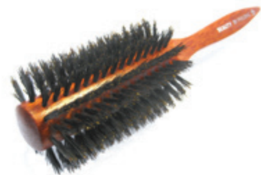
Rundbürste 22cm reine Borste | 10 Reihen