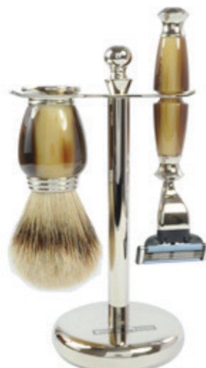
Rasiererzeug Galalith Horn-Optik, braun, Mach 3 shaving set, resin horn look, brown, mach 3