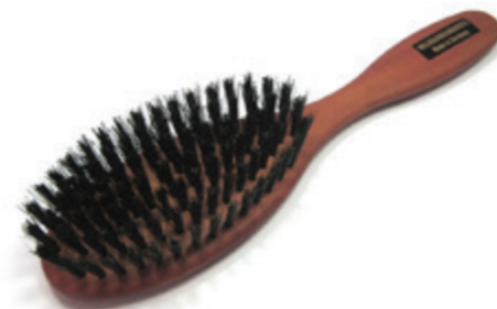
Haarbürste oval 20cm reine Borste | 7 Reihen