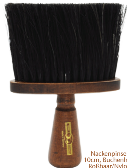
Nackepinsel 10cm, Buchenholz Roßhaar/Nylon neck duster 10cm, beech wood horsehair/nylon

76 1302 0604 sw./bl. 76 1302 0704 br. 76 1302 0204 w.