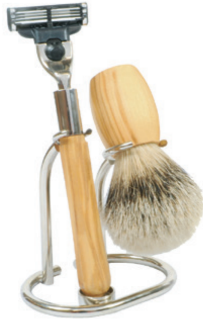
Rasieret Olivenholz shaving set olive wood