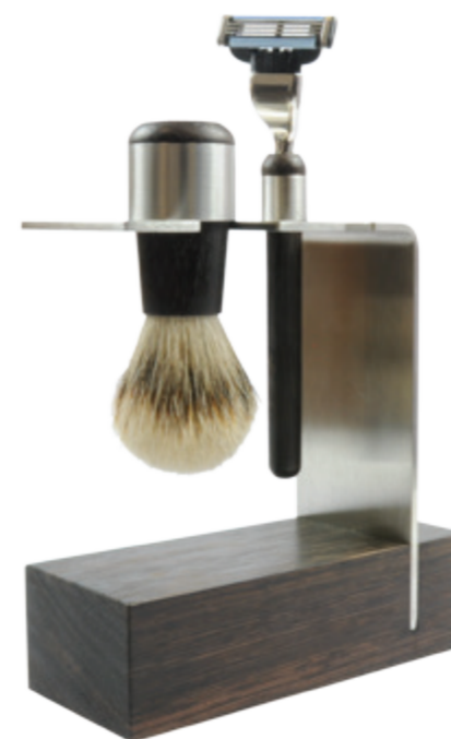
Rasierset, Mach 3 Wengeholz, Edelstahl shaving set, mach 3 wenge wood, stainless