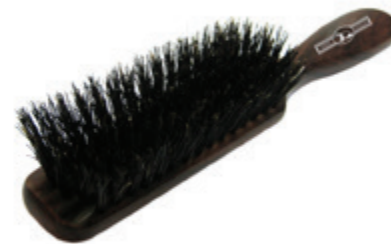
Haarbürste 20cm reine Borste | 6 Reihen