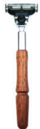
Rasierer Zedernholz-Griff razor cedar wood handle