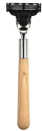
Rasierer Ahorn-Griff razor maple wood handle