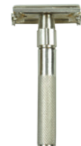
Doppelklingen-Rasierer, nickel butterfly safety razor nickel plated