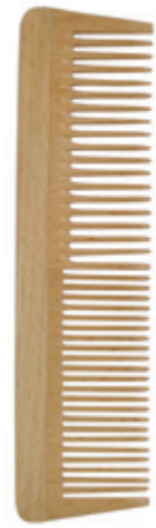
Frisierkamm 17cm* | grob & fein