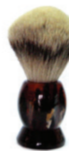
Rasierpinsel Kunststoffgriff havanna shaving brush havanna plastic handle