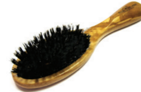
Pneumatic Taschenbürste schwarzes Kissen | 17,5cm reine Borste | 7 Reihen