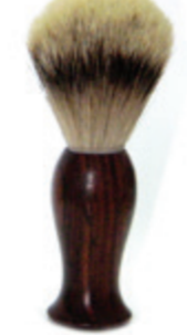
Rasierpinsel Rosenholzgriff shaving brush rose wood handle