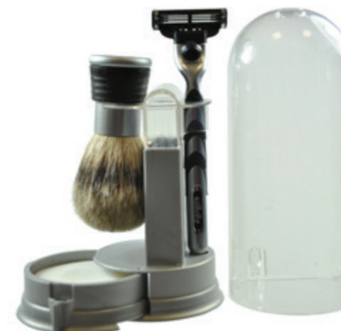
Rasiererzeug für die Reise, grau, mit Seife, Mach 3 travel shaving set grey, with soap, mach 3