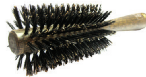
Rundbürste | 21,5cm reine Borste | 9 Reihen