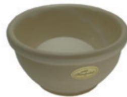
Rasierschale Keramik, natur shaving bowl ceramic, nature Ø 10,5cm