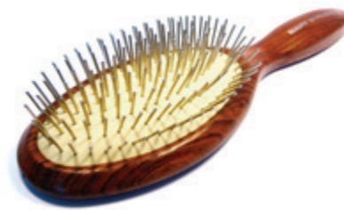
Haarbürste, oval 23cm | Metalstifte | 8 Reihen weißes Kissen