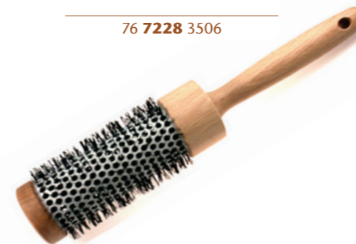
Fönbürste | Keramik 23,5cm | Ø 45mm | hitzebeständige Nylonborsten