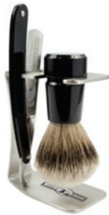
Rasierer set schwarz, Rasiermesser shaving set black, straight razor