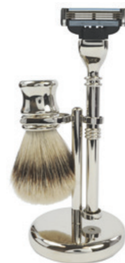
Rasiererzeug verchromt, Mach 3 shaving set, chrome, mach 3