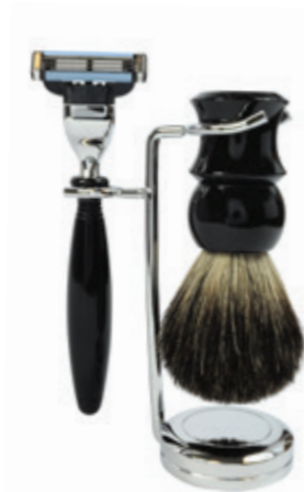
Rasierer set verchromt, Mach 3 schwarz Kunststoff shaving set, black, chrome, mach 3