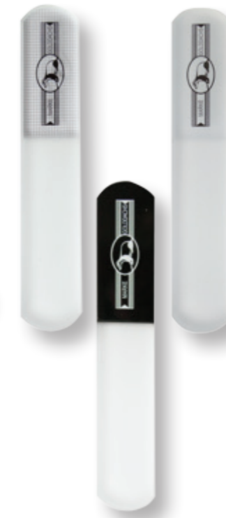
Glas-Nagelfeile MEN 10 cm glass nail file MEN 10 cm

76 9801 0500 transparent 76 9801 0600 schwarz|black 76 9801 8900 gefrostet|frosted mit Hülle with sleeve