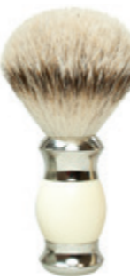
Rasierpinsel beiger Polymergriff shaving brush beige polymer handle