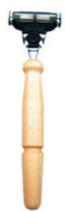
Rasierer Ahorn-Griff razor maple wood handle