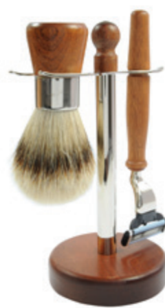
Rasierer set Zedernholz, Mach 3 shaving set cedar wood, mach 3