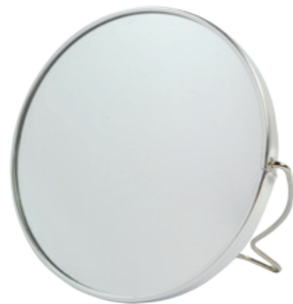
Vintage Rasierspiegel verchromt 2-fach vintage shaving mirror chrome 2x