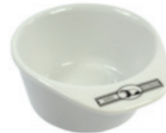
Rasiertasse Porzellan, weiß shaving mug porcelain, white leer | empty Ø 9,5cm