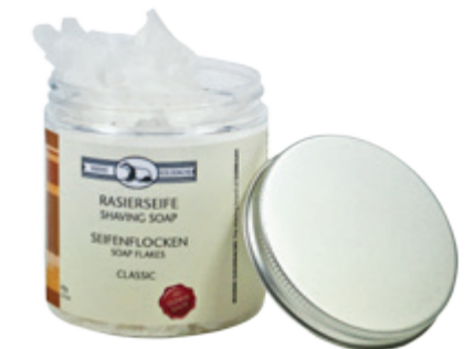
Seifenflocken in PET Schraubtiegel soap flakes in screwed PET jar 1x 60g | 2,1 Oz.