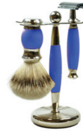
Rasierer set Polymer blau / chrom shaving set blue polymer / chrome

Mach 3 | mach 3 76 4319 821_ Fusion | fusion 76 4319 822_ Doppelklinge | safety razor 76 4319 823_