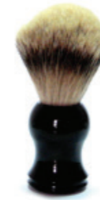
Rasierpinsel schwarzer Kunststoffgriff shaving brush black plastic handle