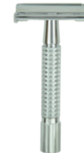
Doppelklingen-Rasierer, chrom butterfly safety razor chrome plated