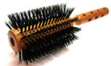
Rundbürste 22cm reine Borsten | 12 Reihen