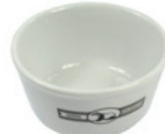
Rasierschale Porzellan, weiß shaving bowl porcelain, white leer | empty Ø 10cm