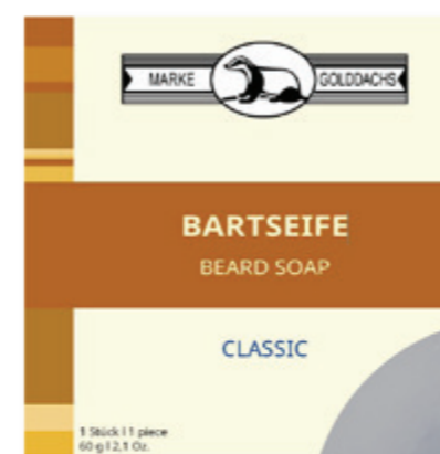
Bartseife (Stück) beard soap (bar) 60g / 2,1 Oz.

76 9801 0500 transparent 76 9801 0600 schwarz|black 76 9801 8900 gefrostet|frosted mit Hülle with sleeve