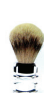
Rasierpinsel transparenter Acrylgriff shaving brush transparent acrylic handle Ø 22mm