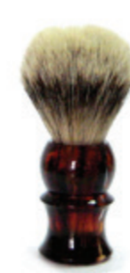
Rasierpinsel Kunststoffgriff havanna shaving brush havannaplastic handle