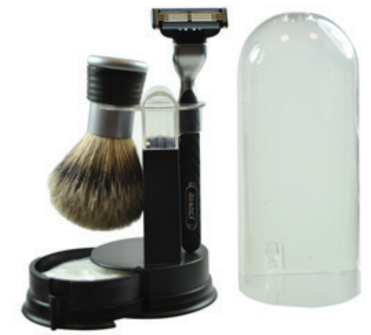
Rasiererzeug für die Reise, schwarz, mit Seife, Mach 3 travel shaving set black, with soap, mach 3