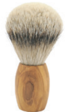
Rasierpinsel Olivenholzgriff shaving brush olive wood handle