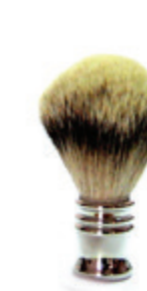
Rasierpinsel Metallgriff, chrom shaving brush metal chrome handle