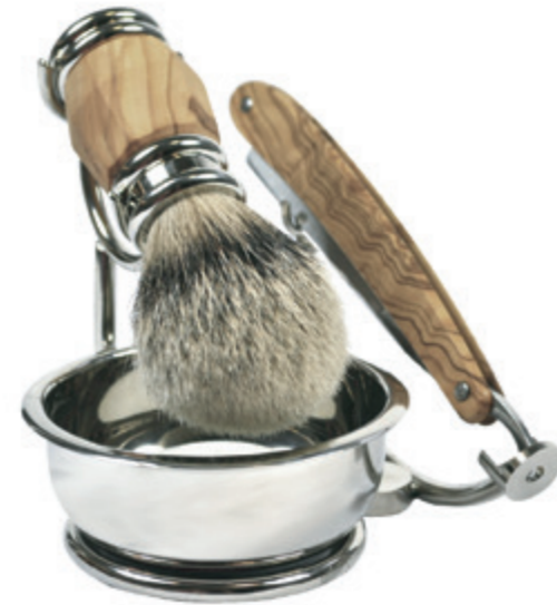
Rasieret Olivenholz shaving set olive wood