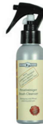
Der GOLDDACHS Pinselreiniger

reintigt und pflegt den Pinsel gründlich durch natürliche Öle. Er sorgt für eine längere Lebensdauer des Rasierpinsels. Einfach 2-3 Sprühstöße in den Pinsel geben, kurz einwirken lassen und mit Wasser ausspülen.