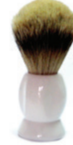
Rasierpinsel weißer Kunststoffgriff shaving brush white plastic handle