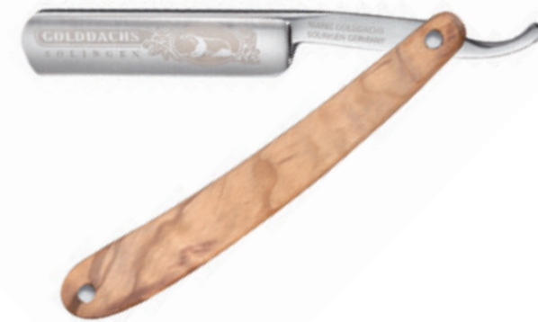
Rasiermesser Olivenholz Schale straight razor olive wood handle