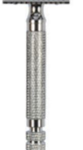
Doppelklingen-Rasierer, nickel 3pc safety razor nickel plated