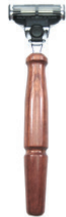
Rasierer Rosenholz-Griff razor rose wood handle