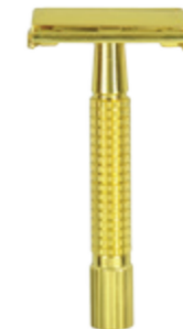
Doppelklingen-Rasierer, goldfarben butterfly safety razor gold color