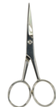
Bartschere vernickelt, 9cm beard scissors nickel plated, 9cm