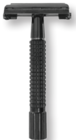
Doppelklingen Rasierer, schwarz butterfly safety razor black

76 2241 0640 glänzend | shiny 76 2241 8840 matt