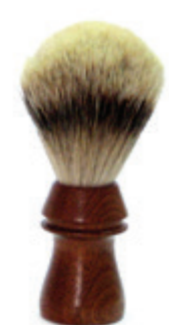
Rasierpinsel Zedernholzgriff shaving brush cedar wood handle