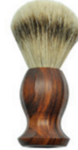
Rasierpinsel Palisander-Griff shaving brush palisander handle