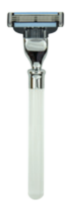
Rasierer transparent Acryl razor transparent acrylic