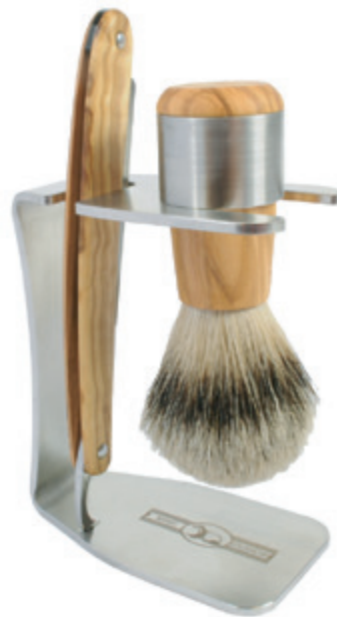
Rasieret Olivenholz shaving set olive wood