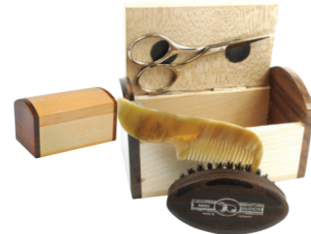
Bart-Box massives Holz 3tlg. beard set massive wood 3 pcs natur - braun | nature - brown