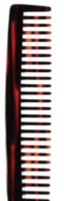
Afrokamm | 15cm* grob