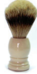
Rasierpinsel elfenbeinfg. Kunststoffgriff shaving brush ivory col. plastic handle