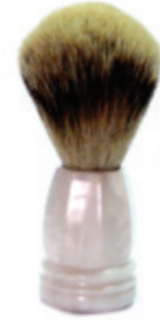
Rasierpinsel perlmutter Kunststoffgriff shaving brush m.o.p. plastic handle