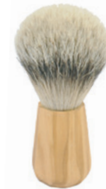
Rasierpinsel Olivenholzgriff shaving brush olive wood handle