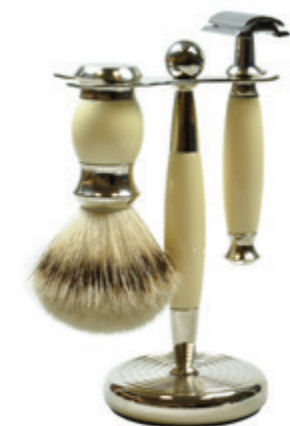
Rasierer set Polymer beige / chrom shaving set beige color / chrome

Mach 3 | mach 3 76 4319 811_ Fusion | fusion 76 4319 812_ Doppelklinge | safety razor 76 4319 813_