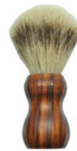
Rasierpinsel Palisander-Griff shaving brush palisander handle