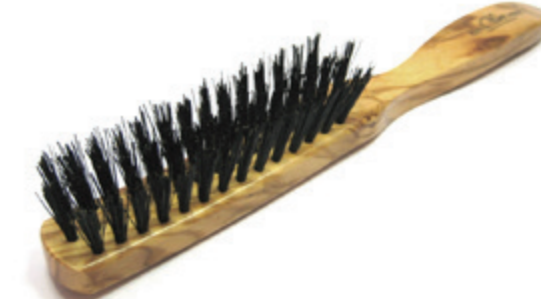
Haarbürste 20,5cm reine Borste | 3 Reihen