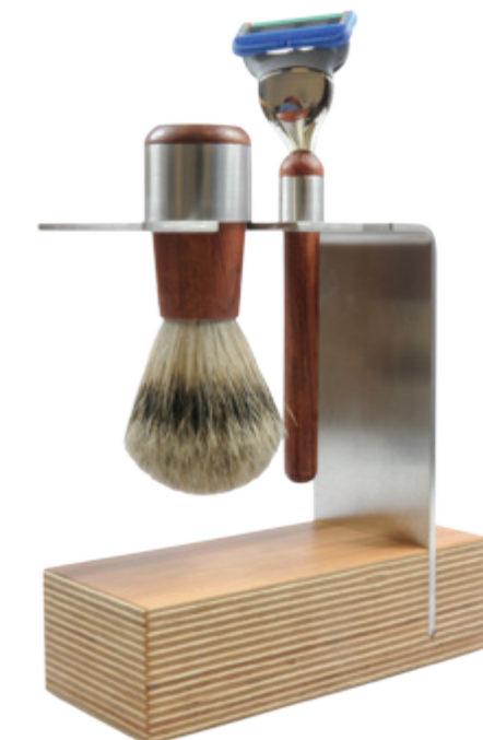
Rasierset, Fusion Multiplex, Edelstahl shaving set, fusion multiplex, stainless