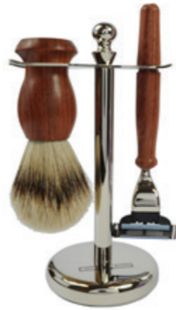
Rasierer set Rosenholz, chrom, Mach 3 shaving set rose wood, chrome, mach 3