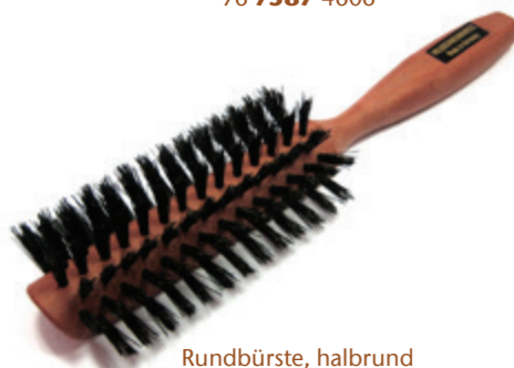
Rundbürste, halbrund 22cm reine Borste | 7 Reihen | 180°