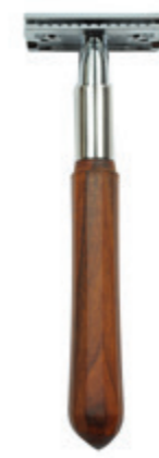
Doppelklingen-Rasierer Palisanderholzgriff 3 pc. safety razor palisander handle