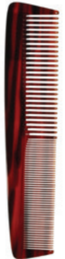
Frisierkamm | 19cm* grob & fein