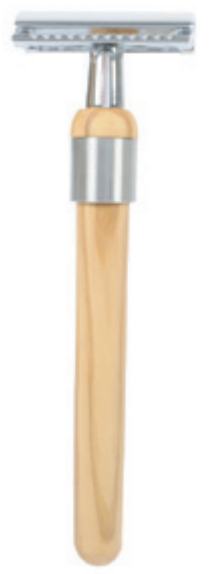
Rasierer Olivenholz-Griff razor olive wood handle