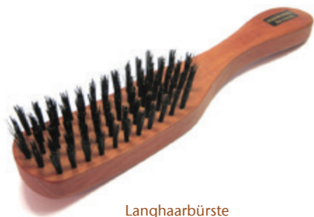
Langhaarbürste 22cm reine Borste | 5 Reihen