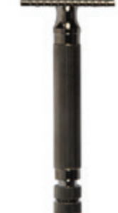
Doppelklingen-Rasierer, titanfarben 3pc safety razor titan color