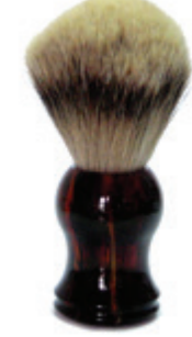
Rasierpinsel Kunststoffgriff havanna shaving brush havanna plastic handle