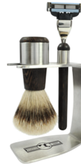
Rasierset, Edelstahl, Wengeholz, Mach 3 shaving set, wenge wood stainless, mach 3