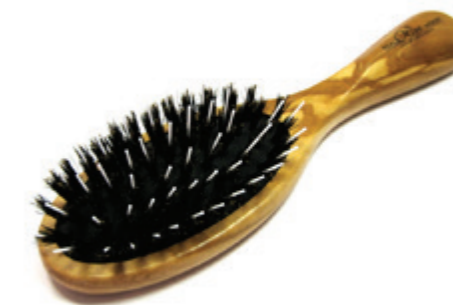
Pneumatic Taschenbürste schwarzes Kissen | 17,5cm reine Borste | 7 Reihen Nylon