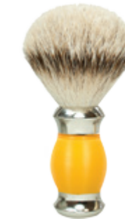
Rasierpinsel gelber Polymergriff shaving brush yellow polymer handle