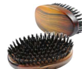
Kardätsche | 11cm reine Borste | 9 Reihen Rosenholz Optik