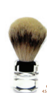
Rasierpinsel transparenter Acrylgriff shaving brush transparent acrylic handle Ø 20mm