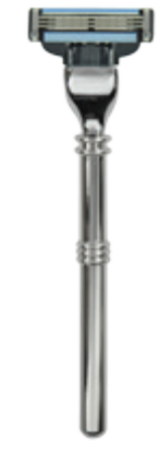
Rasierer Metallgriff razor metal handle