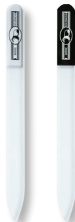
Glas-Nagelfeile 14 cm glass nail file 14 cm

76 9800 0500 transparent 76 9800 0600 schwarz|black mit Hülle with sleeve