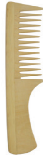
Griffkamm 19cm* | grob