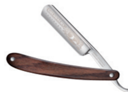
Rasiermesser Indian Rosewood Schale straight razor indian rose wood handle