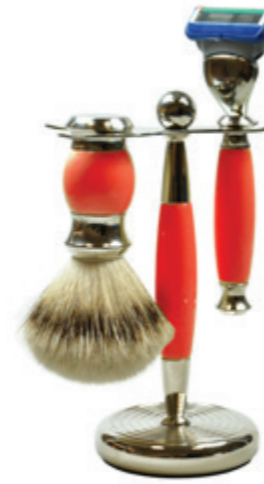
Rasierer set Polymer rot / chrom shaving set red polymer / chrome

Mach 3 | mach 3 76 4319 821_ Fusion | fusion 76 4319 822_ Doppelklinge | safety razor 76 4319 823_