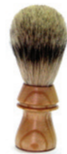
Rasierpinsel Kautschuk-Holzgriff shaving brush rubber wood handle