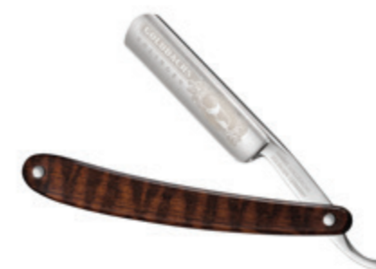
Rasiermesser Schlangen-Holz Schale straight razor snake wood handle