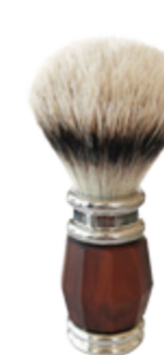
Rasierpinsel Palisander-Griff shaving brush palisander handle