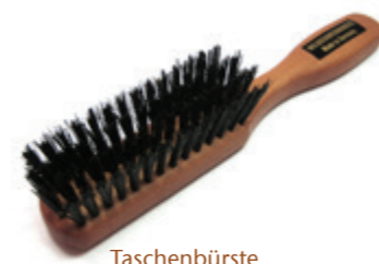
Taschenbürste 15cm reine Borste | 4 Reihen