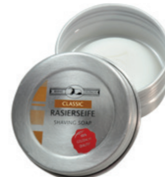
Rasierseife - Aludose shaving soap, travel 60g / 2,1 Oz.