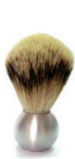
Rasierpinsel Aluminiumgriff shaving brush aluminum handle