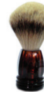
Rasierpinsel Kunststoffgriff havanna shaving brush havannaplastic handle