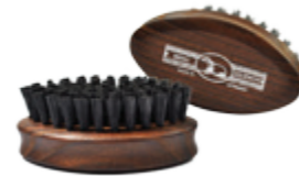
Bartbürste, 6cm Eschenholz, dunkel 6 Reihen beard brush, 6cm ash wood 6 rows