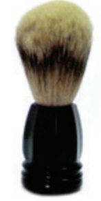
Rasierpinsel schwarzer Kunststoffgriff shaving brush black plastic handle