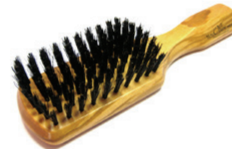
Griff Kardätsche 17,5cm reine Borste | 8 Reihen