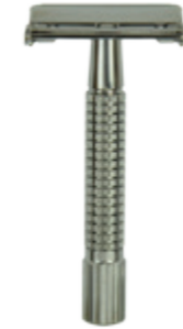
Doppelklingen-Rasierer, titanfarben butterfly safety razor titan color