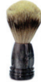
Rasierpinsel grauer Kunststoffgriff shaving brush grey plastic handle