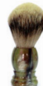
Rasierpinsel marmor Kunststoffgriff shaving brush plastic marble handle