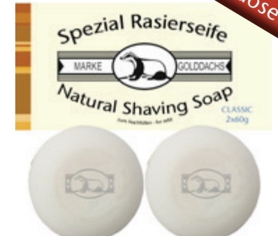
Rasierseife (refill) shaving soap (refill) 2x 60g / 2,1 Oz.