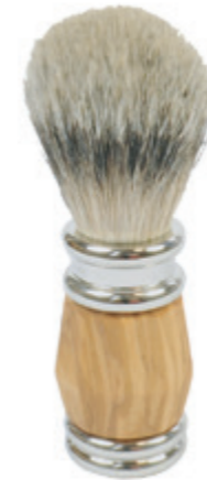
Rasierpinsel Olivenholzgriff shaving brush olive wood handle