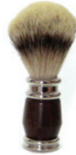
Rasierpinsel Rosenholzgriff shaving brush rose wood handle