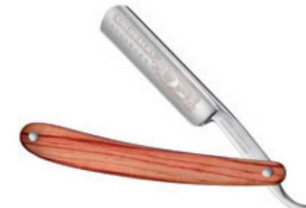
Rasiermesser Palo Rosa Schale straight razor palo rosa wood handle