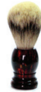
Rasierpinsel Kunststoffgriff havanna shaving brush havanna plastic handle