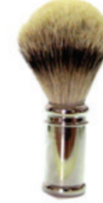
Rasierpinsel Metallgriff, chrom shaving brush metal chrome handle