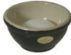
Rasierschale Keramik, schwarz shaving bowl ceramic, black Ø 10,5cm