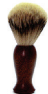
Rasierpinsel Zedernholzgriff shaving brush cedar wood handle