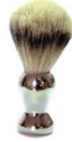
Rasierpinsel Kunststoffgriff, silber shaving brush plastic handle, silver