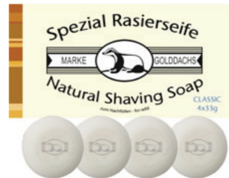
Rasierseife (refill) shaving soap (refill) 4 x 33g / 1,16 Oz.