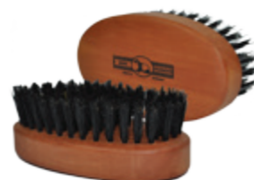
Bartbürste, 9,5cm Birnenholz 7 Reihen beard brush, 9,5cm pear wood 7 rows