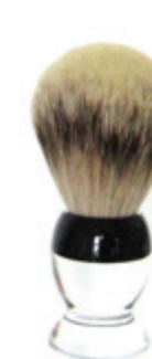
Rasierpinsel transparenter Acrylgriff shaving brush transparent acrylic handle Ø 22mm