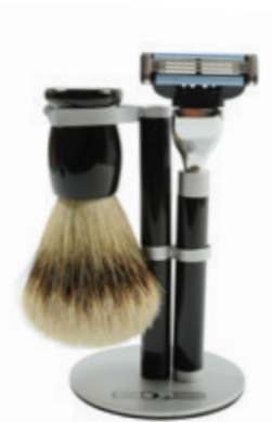
Rasierer set schwarz, Mach 3 shaving set black, mach 3