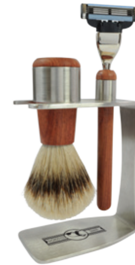
Rasierset, Edelstahl, Rosenholz, Mach 3 shaving set, rosewood stainless, mach 3