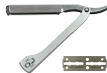
Rasierer mit Wechselklinge Aluminium, 65mm Klinge Razor with blade aluminum, 65mm blade