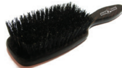
Langhaarbürste 22cm | reine Borste 8 Reihen | eckig