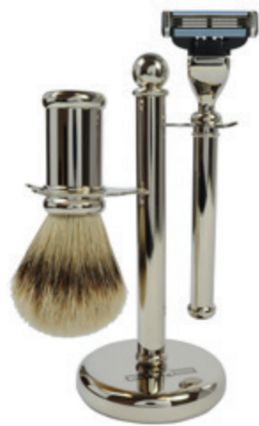
Rasiererzeug verchromt, Mach 3 shaving set chrome, mach 3