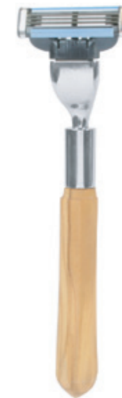
Rasierer Olivenholz-Griff razor olive wood handle