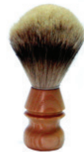
Rasierpinsel Kautschuk-Holzgriff shaving brush rubber wood handle