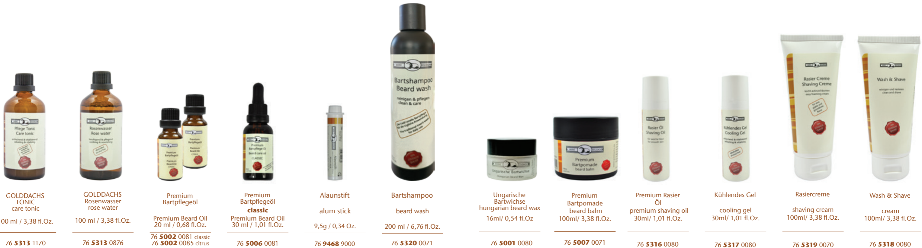
GOLDDACHS TONIC care tonic 100 ml / 3,38 fl.Oz. 76 5313 1170 GOLDDACHS Rosenwasser rose water 100 ml / 3,38 fl.Oz. 76 5313 0876 Premium Bartpflegeöl Premium Beard Oil 20 ml / 0,68 fl.Oz. 76 5002 0081 classic 76 5002 0085 citrus Premium Bartpflegeöl classic Premium Beard Oil 30 ml / 1,01 fl.Oz. 76 5006 0081 Alaunstift alum stick 9,5g / 0,34 Oz. 76 9468 9000 Bartshampoo beard wash 200 ml / 6,76 fl.Oz. 76 5320 0071 Ungarische Bartwiche hungarian beard wax 16ml / 0,54 fl.Oz. 76 5001 0080 Premium Bartpomade beard balm 100ml / 3,38 fl.Oz. 76 5007 0071 Premium Rasier Öl premium shaving oil 30ml / 1,01 fl.Oz. 76 5316 0080 Kühlendes Gel cooling gel 30ml / 1,01 fl.Oz. 76 5317 0080 Rasiercreme shaving cream 100ml / 3,38 fl.Oz. 76 5319 0070 Wash & Shave cream 100ml / 3,38 fl.Oz. 76 5318 0080

2 in 1 product, cleans the skin. Use the resulting foam for shaving. Ideal for travel and home use.