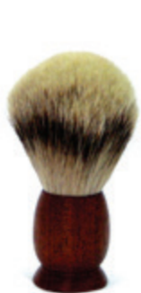
Rasierpinsel Zedernholzgriff shaving brush cedar wood handle