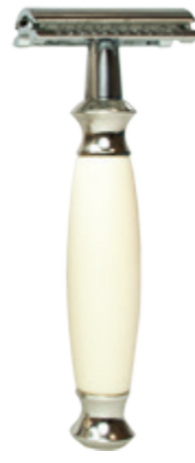
Doppelklingen-Rasierer beiger Polymergriff 3 pc. safety razor beige polymer handle