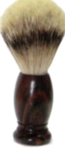
Rasierpinsel Rosenholzgriff shaving brush rose wood handle