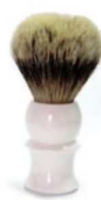
Rasierpinsel weißer Kunststoffgriff shaving brush white plastic handle