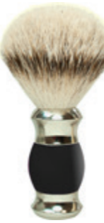
Rasierpinsel schwarzer Polymergriff shaving brush black polymer handle