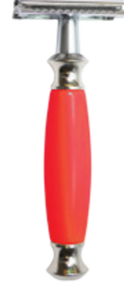
Doppelklingen-Rasierer roter Polymergriff 3 pc. safety razor red polymer handle