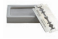
Doppelklingen 10er Pack spare blades 10 pc. pack