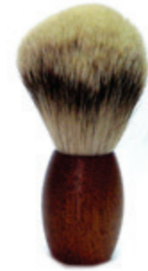
Rasierpinsel Zedernholzgriff shaving brush cedar wood handle