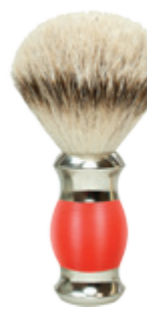
Rasierpinsel roter Polymergriff shaving brush red polymer handle