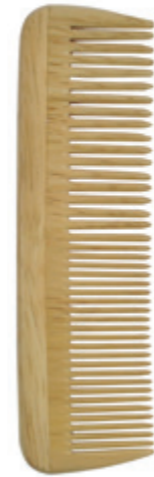
Frisierkamm 17cm* | grob & fein