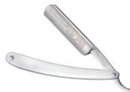
Rasiermesser Kunststoffschale, weiß straight razor polymer handle, white