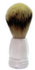
Rasierpinsel weißer Kunststoffgriff shaving brush white plastic handle