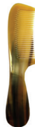
Griffkamm ca. 19cm*