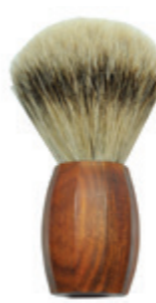
Rasierpinsel Palisander-Griff shaving brush palisander handle