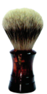
Rasierpinsel Kunststoffgriff havanna shaving brush havanna plastic handle