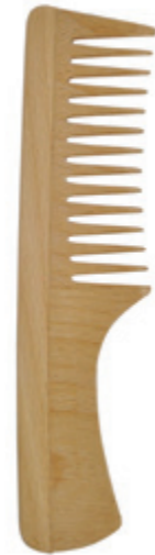
Griffkamm 19cm* | grob