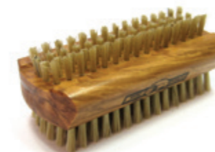
Handwaschbürste 9,5cm helle Borste | stark