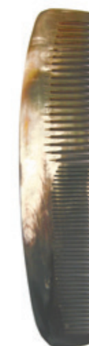
Damenkamm ca. 17cm* grob & fein