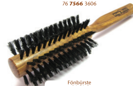
Fönbürste rund | 21,5cm reine Borste | 10 Reihen