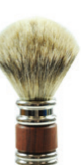
Rasierpinsel Palisander-Griff shaving brush palisander handle