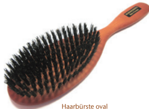
Haarbürste oval 23cm reine Borste | 10 Reihen