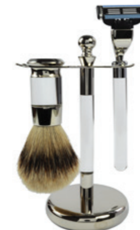
Rasiererzeug Acryl, chrom, Mach 3 shaving set acrylic, chrome, mach 3