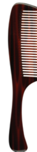
Griffkamm | 19cm* fein