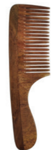
Griffkamm 19cm* | fein ca.