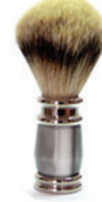
Rasierpinsel grauer Kunstharzgriff shaving brush grey resin handle