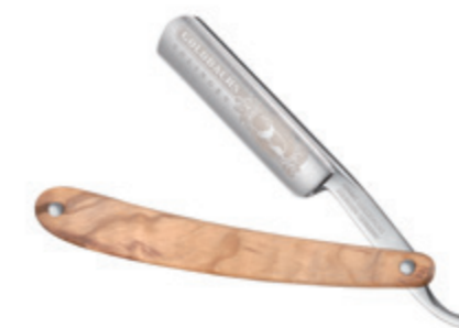
Rasiermesser Olivenholz Schale straight razor olive wood handle