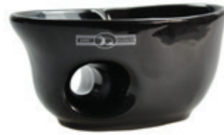
Rasiertasse Keramik, schwarz shaving mug ceramic black Ø 13,5cm