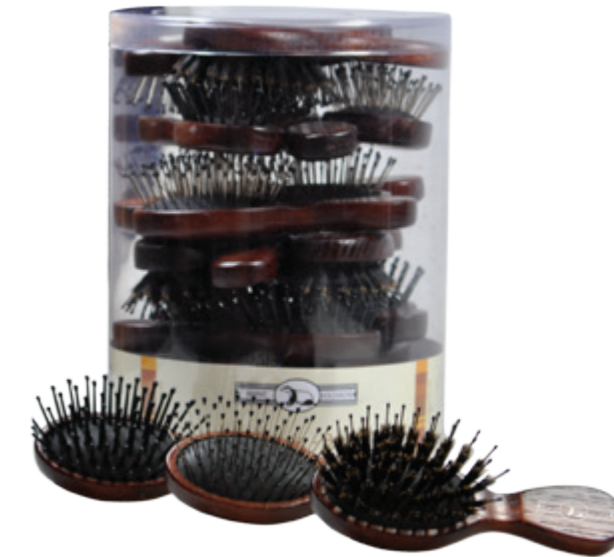
Mini Pneumatik Holzbürste, 24 Coniferiebürsten in transparenter Dose drei Sorten zu je 8 Stk. - Nylonstifte, Drahtstifte, Borste mit Nylonstiften, 12cm