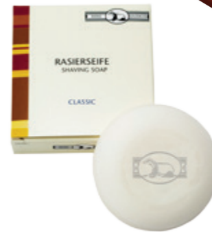
Rasierseife (refill) shaving soap (refill) 60g / 2,1 Oz.