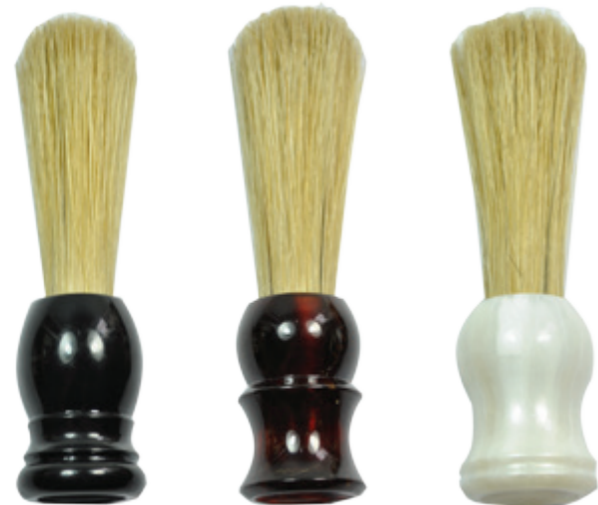
Barbier-Pinsel Rosshaar barbers-brush long horse bristle

76 1302 0604 sw./bl. 76 1302 0704 br. 76 1302 0204 w.