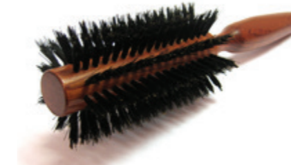
Rundbürste 22cm reine Borste | 10 Reihen