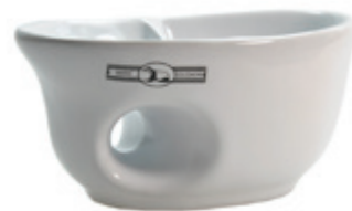
Rasiertasse Keramik, weiß shaving mug ceramic white Ø 13,5cm